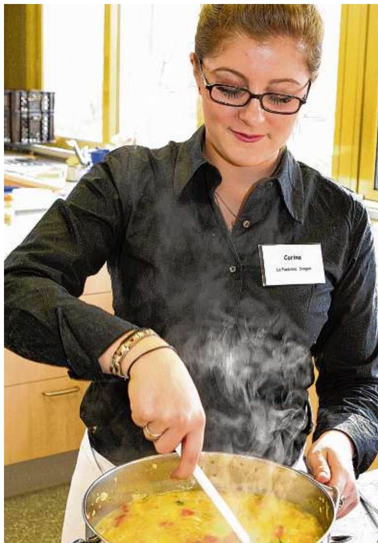
Auch in Küche und Hauswirtschaft gibt es Ausbildungsberufe mit Perspektive

➤ Englisch-Zertifikat: Im Rahmen des berufsbezogenen Englisch-Unterrichts im ersten und zweiten Ausbildungsjahr kann im Rahmen einer landesweit einheitlichen Abschlussprüfung am Berufsschulzentrum Radolfzell, der Robert-Gerwig-Schule Singen und Wessenberg-Schule Konstanz das KMK-Fremdsprachenzertifikat erworben werden – eine in der Wirtschaft sehr geschätzte Zusatzqualifikation.