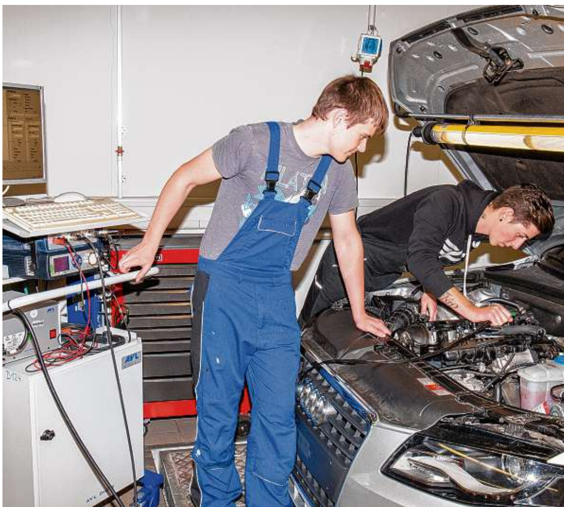
Die Fachschulen bieten Berufstätigen mit abgeschlossener Berufsausbildung - wie hier Kraftfahrzeugtechniker - die Möglichkeit, sich auf eine Tätigkeit im mittleren Management oder auf Leitungsaufgaben vorzubereiten.

► Automatisierungstechnik: Zentrales Element des Unterrichts sind mechatronische Systeme. Programmierung von Speicherprogrammierbaren Steuerungen, Dimensionierung und Auswahl von Aktoren und Sensoren sowie das komplexe Zusammenspiel