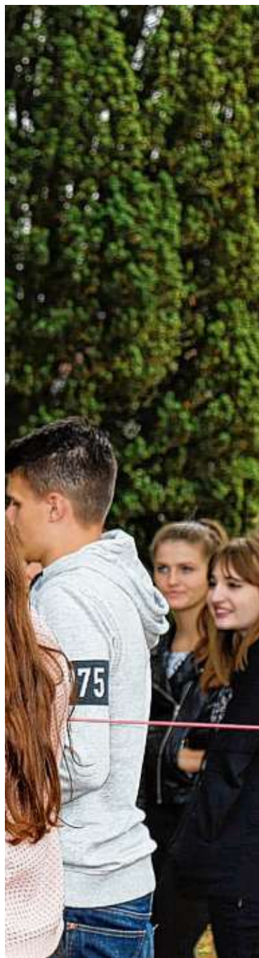
gen Wege ins Berufsleben auf und

Schüler, die ihre Stärken im Verwaltungsbereich oder in einer kaufmännischen Tätigkeit sehen, die richtige Schulart. Die Wirtschaftsschule ist berufsvorbereitend und vertieft die Allgemeinbildung. Auf alle Berufe im kaufmännischen oder im Verwaltungsbereich bereitet diese Schulart sehr gut vor: Kaufmann im Einzelhandel, Industriekaufmann, Kaufmann für Versicherungen und Finanzen, Kaufmann/-frau im Groß- und Außenhandel, Bankkaufmann/-frau.