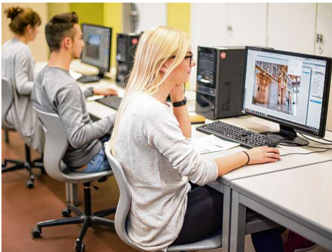
Der Weg zum Studium muss nicht zwingend übers Abitur führen. Auch Fachhochschulen bieten qualifizierte Studiengänge an.

1 Die Berufskollegs I + II: Das technische Berufskolleg baut auf das BK I auf. Es kann mit der Fachhochschulreife abgeschlossen werden. Über einen Zusatzunterricht kann der Abschluss „Technischer Assistent“ erworben werden. Neben den Fächern Deutsch, Englisch und Mathematik wird das Profil durch Schwerpunkte wie „Grundlagen der Technik“, „Informations- und Medientechnik“ sowie „Technische Dokumentation“ und „angewandte Technik“ geprägt. Im Unterricht sind auch Dozenten aus der Praxis eingesetzt; Projektarbeit und ein dreiwöchiges betriebliches Praktikum ermöglichen neben Anwendungsmodulen in der Schule Erfahrungen in der Praxis. Standort: Berufsschulzentrum Stockach.