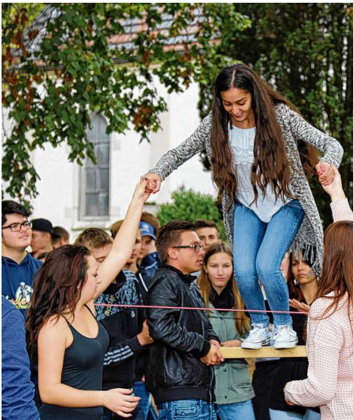
Mit der richtigen Unterstützung lassen sich Hürden meistern: Die Berufsschulen im Landkreis Konstanz zeigen die vielfältigen Partner für Aus- und Fortbildung an.

► In der zweijährigen Berufsfachschule für Elektrotechnik (2BFE) dreht sich die Theorie und Praxis hauptsächlich um die Elektrotechnik: Aufbau und Funktionsweise von elektrotechnischen Schaltungen sind zentrale Elemente des Unterrichts. Weitere berufliche Inhalte werden im Rahmen der Computertechnik vermittelt. Anschließend Ausbildungsbereufe im gleichen Berufsfeld können beispielsweise Elektroinstallateur oder Elektroniker für Gebäudetechnik sein. Standort: Hohentwiel-Gewerbeschule Singen