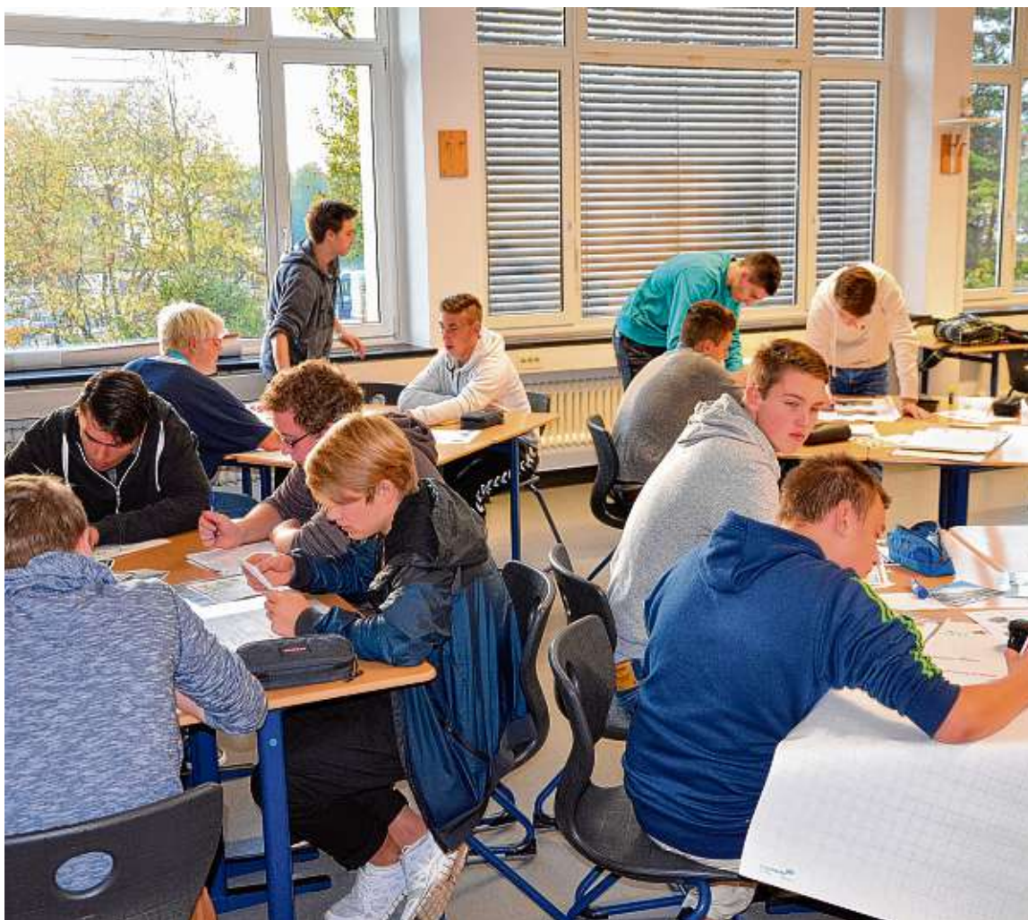
Nach erfolgreichem Abschluss der Klasse 13 gibt es auch an den beruflichen Gymnasien im Kreis die allgemeine Hochschulreife.

Die Angebote an den beruflichen Schulen im Landkreis Konstanz sind vielfältig: Wirtschaftliche Themen sind mittlerweile ebenso feste Bestandteile des Unterrichtsalltages geworden, wie innovative technische Entwicklungen, die sich in den vielfältigen Profildächern der beruflichen Gymnasien widerspiegeln. Speziell für technikbegeisterte Jugendliche ist der sechsjährige gymnasiale Bildungsgang eingerichtet worden. Für das 6-jährige TG gelten andere Anmeldefristen.