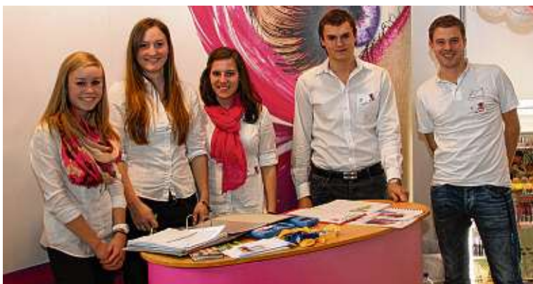
Das duale Berufskolleg internationales Wirtschaftsmanagement öffnet die Türen in eine globalisierte Karriere.