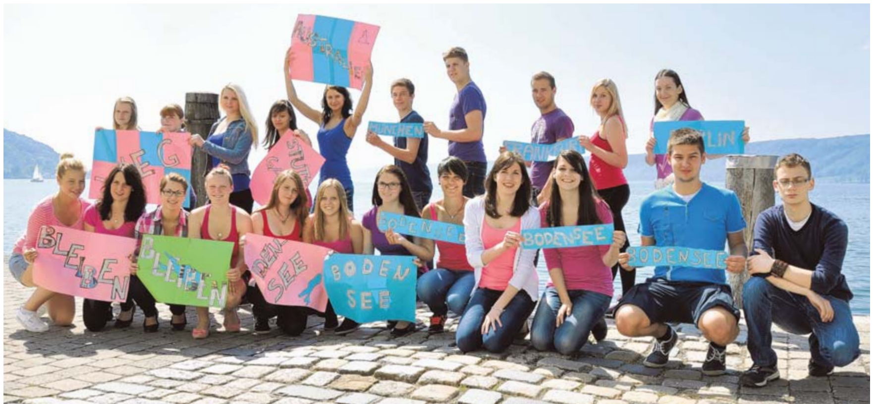
Die einen wollen in der Heimat bleiben, die anderen zieht es in die weite Welt: Die Schüler der Klasse BK1W1/1 vom Berufsschulzentrum Stockach haben sich mit dem Leben am Bodensee beschäftigt.

Ich bin 18 Jahre alt und besuche die Klasse BK1W1/1 am Berufsschulzentrum Stockach. Warum will ich weg? Weil ich etwas Neues erleben möchte, Sozialkontakte knüpfen, neue Eindrücke in meinem Leben bekommen und selbstständig sein. Ich finde, heutzutage können wir, die jungen Erwachsenen, weiter weg als früher, da wir heute viel mehr Möglichkeiten haben, mit unseren Familien zu kommunizieren. Wir haben Skype, Facebook und viele weitere Mittel, mit denen wir kostenlos chatten und anrufen können. So können wir ein Stück Heimat immer bei uns haben. Außerdem können wir so neue Freunde finden und mit den alten in Kontakt bleiben. Daher möchte ich weg, auf eigene Beine stehen und etwas von der Welt sehen.