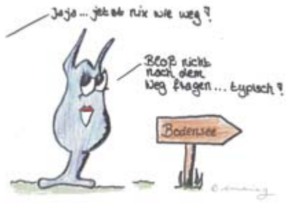
Weg wollen viele, aber wohin ist die Frage. Und einen Rat nimmt nicht jeder an.